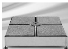
Sockel 180/240 kg