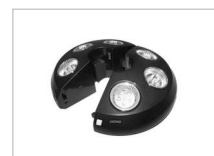
LED-Akku-Licht LED accu light Eclairage accu LED