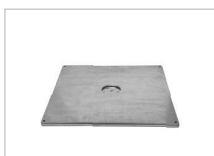
Stahlsockel mit Beschwerungsplatte Steel base with Add-on weight Socle en acier avec Plaque de charge