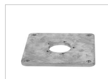
Montageplatte Mounting plate Plaque de montage