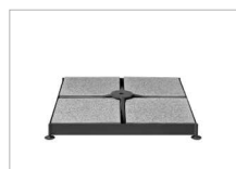
Sockelrahmen mit Platten Base frame with slabs Châssis du socle avec dalles