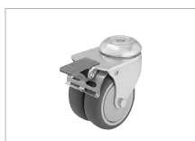
Rollenset mit Bremsen Castor-Set with brake Jeu de roulettes avec frein