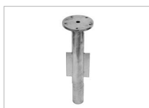
Bodenhülle In-ground tube Douille à sceller