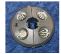
Osyrior Akku- Licht

(Auszug aus Glatz Info Plattform – Technische Änderungen vorbehalten – Febr. 2012)