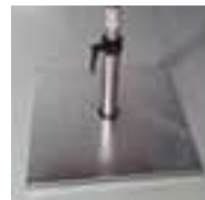
Metall Platte Z 40 kg, Standrohr