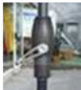
Handkurbel Alu Style

Zubehör: Schutzhülle Standard oder mit Stab und Reissverschluss, Osyrior Akku-Licht.