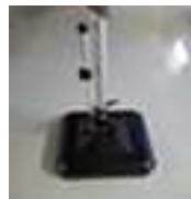
LiRo Sockel 45 kg, 50 x 50 cm, anthrazit.