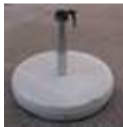
Betonsockel Z; 40,55+70kg, Standrohr