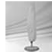
Schutzhülle; Stab & Reissverschluss