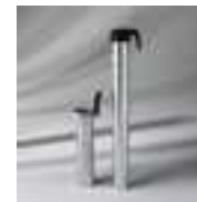
Bodenhülse BT mit Standrohr