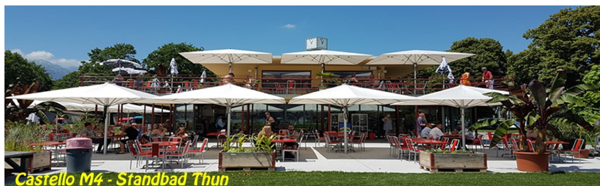
Castello M4 - Standbad Thun