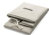
Schutzhülle CHF 99.--