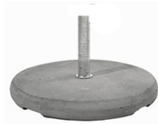
Betonsockel Z mit Standrohr P+, 90 kg, Ø 75 / 11 cm, grau CHF 288.--