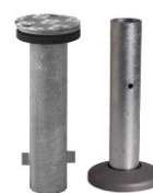
Bodenhülse M4 Stahl verzinkt Standrohr P+ CHF 288.--