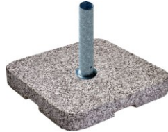
Granitsockel Z mit Edelstahlrohr P+, 90 kg, 64 x 64 x 9 cm, grau CHF 438.--