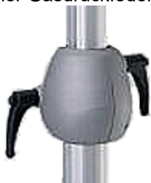
Klemmhebel für Höhen- und Seiten-Einstellung

Dem PENDALEX® P+ sieht man nicht an, wieviel Technik in ihm steckt. Beim genaueren Hinsehen besticht er mit hochwertigen Materialien wie Aluminium, glasfaserverstärktem TSG-Kunststoff sowie verzinkten Schirmstreben aus vergütetem Federstahl. Auch beeindruckt er mit einer Gasdruckfeder im Schirmmast, mit der die Schirmhöhe verstellbar ist.