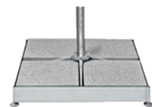
Sockel M4 120 kg, Stahl verzinkt CHF 474.-- 8 Platten CHF 155.--