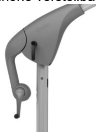
Kurbelantrieb zum Öffnen und Schliessen