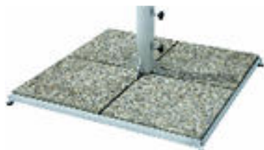
verzinkt ohne Platten; Stock Ø 85mm ca. 24 kg; CHF 325.-- 8 Gartenplatten 50 x 50 x 4 cm