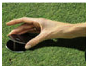
Bodenhülse 2-teilig mit Sicherungsstift Mast-Ø - 50 mm