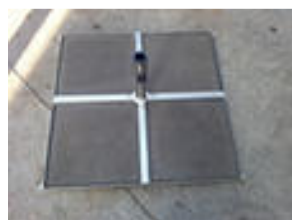
Plattenständer „D-11“ Stahl verzinkt, (80kg) CHF 175.--

(ohne 4-40er Platten) Rohr Ø 25 / 44 mm CHF 48.--