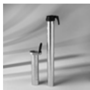
Bodenhülse BT Übergangrohr Stahl verzinkt Ø 35 / 39 mm