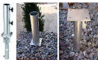
Bodenhülse 2-teilig Oberteil 40 cm Stock Ø 85 mm CHF 185.--