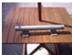
Wand-Bride „S“ Stahl verzinkt Rohr Ø 31 -40 mm