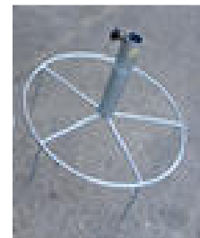
Grösse "S" Mast Ø 30 mm CHF 42.--