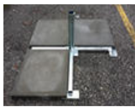
Plattenständer einfach „ D-07“ Stahl verzinkt, (85kg) (o. 50er Platten) CHF 145.--