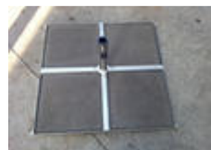
Plattenständer „D-12“ Stahl verzinkt, (150kg)

(ohne 4-40er Platten) Rohr Ø 25 / 44 mm CHF 48.--