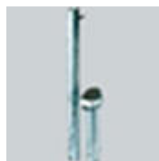
Bodenhülse ST; Übergangrohr Stahl verzinkt Ø 25 - 33 mm