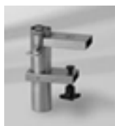
Bride „U“, Edelstahl Stock Ø 31-40 mm