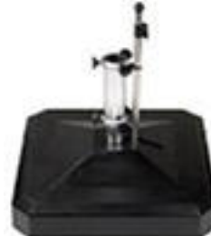
LiRo Midi Plus 100 kg; 75 x 75 mm Stock Ø 55 mm ca. CHF 985.--