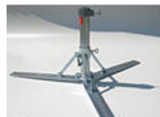
Klappständer für Marktfahrer Stahl verzinkt; Ø 33-56 mm