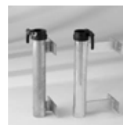
Wandbride mit 3 cm/15 cm Stock Ø 54 – 56 mm