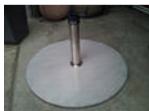
Edelstahl Plattenständer & Zusatzplatte; 65 kg Ø 70 cm CHF 965.-- Edelstahlrohr