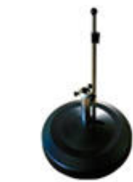
LiRo Mini Plus 60kg; Ø 61 cm Stock Ø 25 – 53 mm ca. CHF 498.--