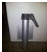
Wandbride „BZ“, Aluminium Stock Ø 38/39 mm