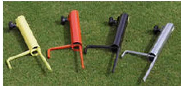
Masse:ca. Ø 45 x L 390 mm