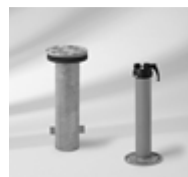
Bodenhülse M4 mit Deckel + Standrohr Stahl verzinkt Ø 48–55 mm