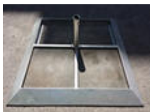
Plattenständer „D-21“ Stahl verzinkt, (ca. 90kg) (ohne 4-40er Platten) Rohr Ø 25 / 55 mm

(ohne 8-40er Platten) Rohr Ø 25 / 55 mm CHF 55.--