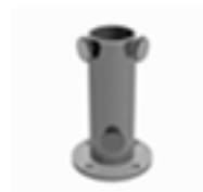
Standrohr S 50 Stahl verzinkt, für Mast-Ø - 50 mm