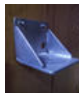
Wandkonsole „B“ Edelstahl