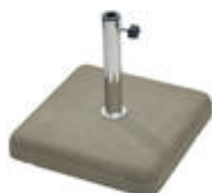
ANCONA , grau

Betonsockel mit Edelstahlrohr 35 kg, 4-eckig Rohr Ø 26 - 44 mm CHF 85.-- Rollensatz CHF 30.--