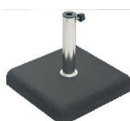
ANCONA , anthraz.

Betonsockel mit Edelstahlrohr 35 kg, 4-eckig Rohr Ø 26 - 44 mm CHF 95.-- Rollensatz CHF 30.--