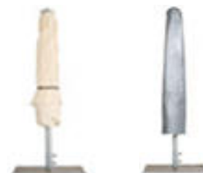
Hülle Standard für Transport und Lagerung aus beschichtetem Gewebe