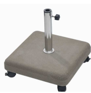
Betonsockel, 35 kg