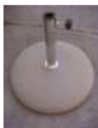
Betonsockel, 30 kg