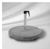
Betonsockel, 55 kg