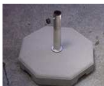
Betonsockel, 65 kg