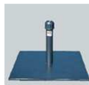
Metall Sockelplatte, 22 kg