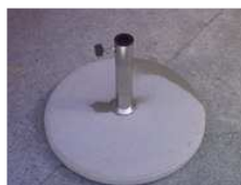
Betonsockel, 40 kg