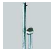
Bodenhülse mit Standrohr